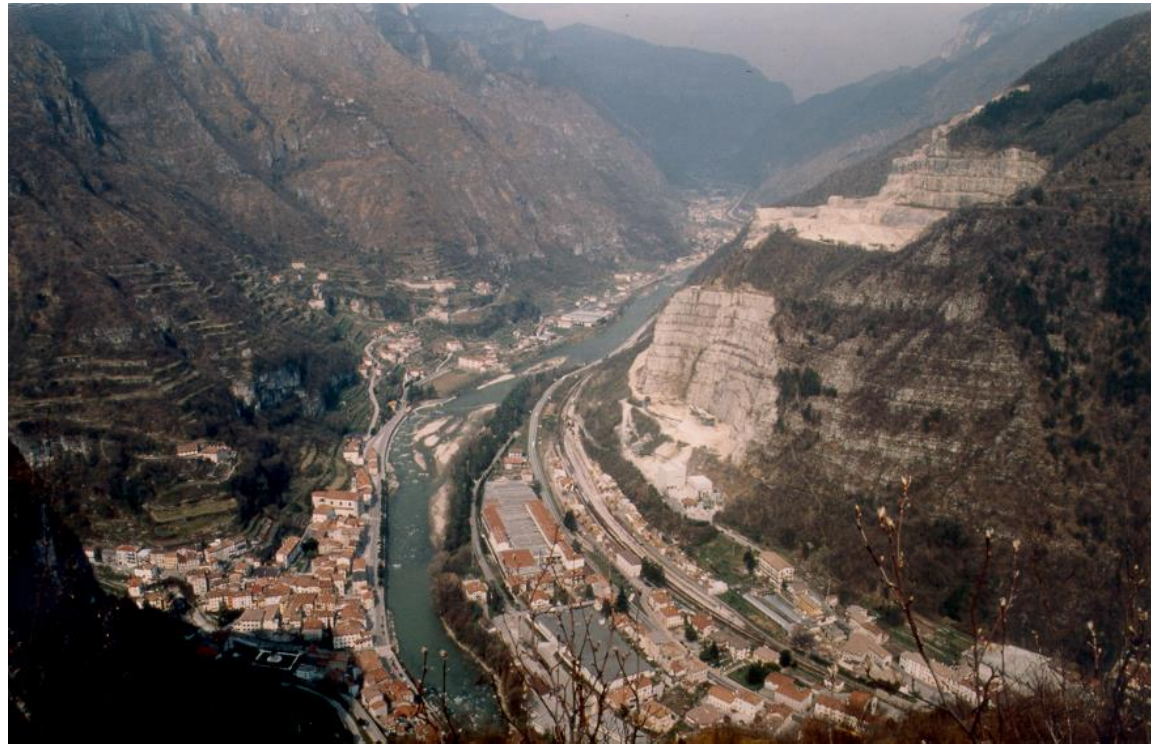
Figura 1: Uno scorcio del Canale di Brenta, stretta valle prealpina tra Veneto e Trentino, a nord di Bassano del Grappa

Se le finalità e gli obiettivi educativi possono in linea generale essere gli stessi, diverse evidentemente sono le attività che è possibile sviluppare nel caso di un Osservatorio che operi a scala locale, in cui viene posta al centro la specificità del paesaggio in questione e, soprattutto, in cui è più direttamente possibile coinvolgere le scuole nelle attività dell'Osservatorio stesso.