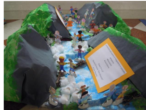
Figura 3 – Il Canale di Brenta con i suoi abitanti e frequentatori, di ieri e di oggi, secondo una lettura connotativa, interpretativa e temporale (scuola primaria)