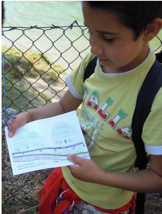
Figura 6 – Un bambino mostra la cartolina che attaccherà al palloncino, per lanciare un messaggio di accoglienza oltre i confini del proprio paesaggio

Lo sguardo dei ragazzi sul paesaggio, inoltre, come visto nel paragrafo precedente, nella sua semplicità che non è mai banalità, è in grado di sollevare questioni, individuare proposte, sollecitare interventi.