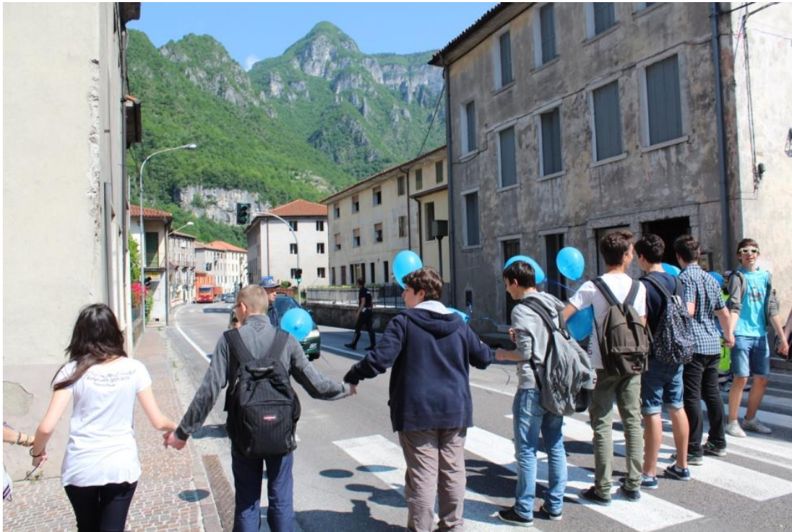
Figura 5 - La catena umana di ragazzi durante il Festival del Paesaggio, momento simbolico di partecipazione e di espressione del desiderio di riappropriarsi del proprio luogo di vita.

L'Osservatorio del Paesaggio è stato qui pensato anche come uno strumento a disposizione delle comunità locali, al fine di individuare modelli di sviluppo aderenti alle caratteristiche del territorio locale, per valorizzare il proprio patrimonio naturale e culturale e per condividere una progettualità al di là delle divisioni campanilistiche.